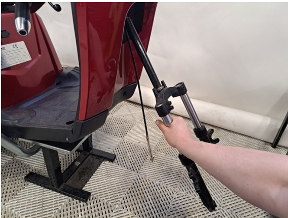
Laske keula alas.