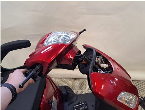
Siirrä ohjaustanko sivuun.