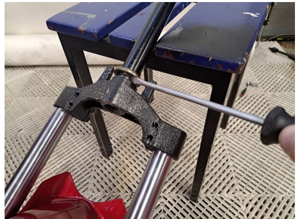
Ota alemman ohjauslaakerin kooli pois.

Uuden osan asennus käänteisessä järjestyksessä.